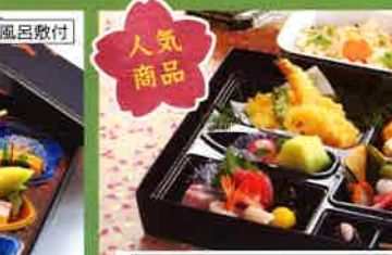
651 お持ち帰り箱御膳会席 27.1×30.2cm 3,200円(税別)