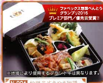
N-006 松阪牛すきやき御膳 25×25×4.5cm 3,500円(税別)