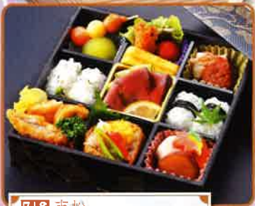
718 市松 19.5×19.5×5cm 1,300円(税別)

お祝いの席への彩りに。ご家族や、会社、サークルの集まりのお供に。多彩なメニューの中から用途やお好みに合わせてお選び下さい。