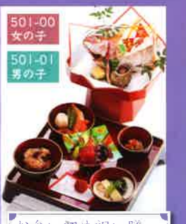
お食い初め祝い膳 20×20×14.5cm、26×26×6cm 4,600円(税別)