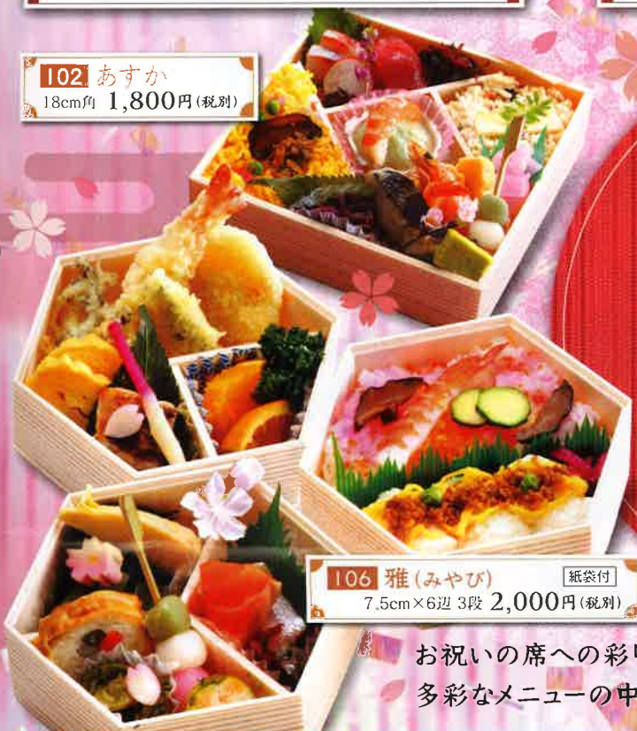
106 雅(みやび) 紙袋付 7.5cm×6辺 3段 2,000円(税別)