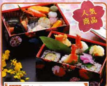
111 天むす 10×14.5×5cm 2段 1,500円(税別)