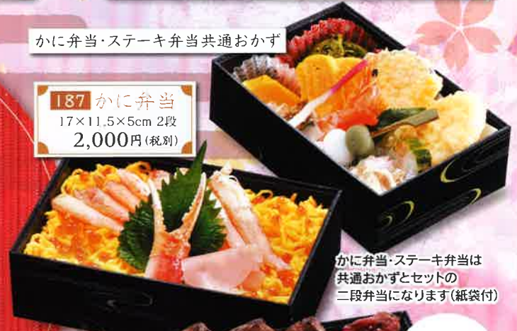
187 かに弁当 17×11.5×5cm 2段 2,000円(税別)