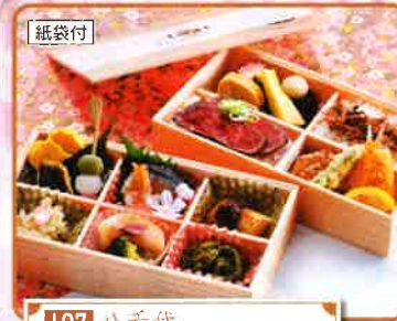
107 八千代 12.5×22cm 2段 2,500円(税別)