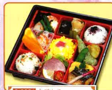
C-0031 なでしこ 21cm角×4.5cm 1,000円(税別)