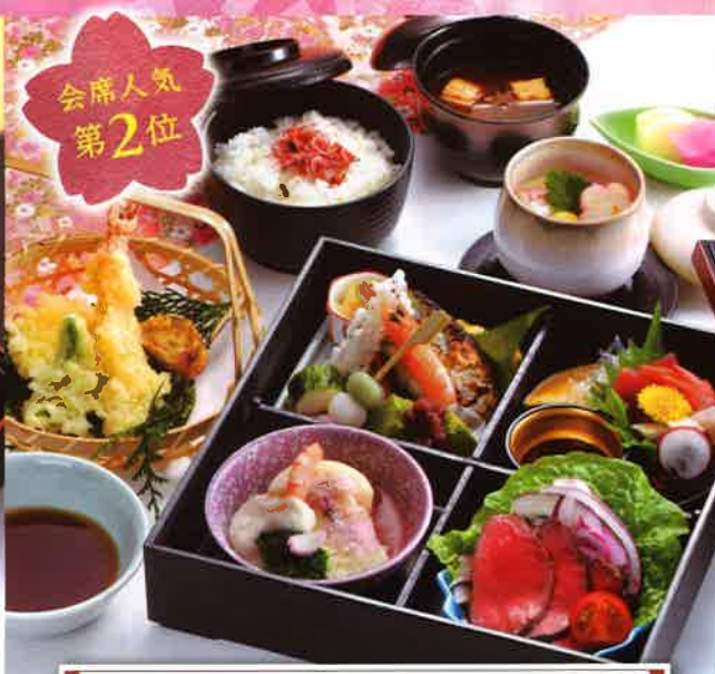
202 松華堂御膳 24cm 角 2,750円(税別)