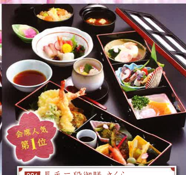
206 長手二段御膳 さくら 12.5×36.3cm 2段 3,400円(税別)