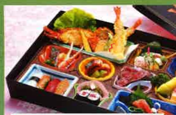
653 お持ち帰り箱御膳会席 31.5×44cm 5,200円(税別)