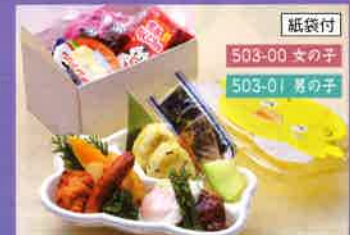
お持ち帰りお子様御膳 20.3×16cm 1,000円(税別)