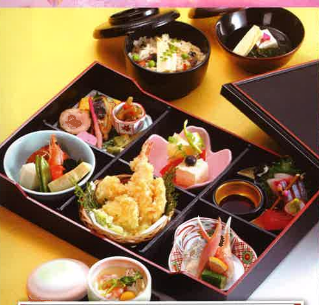
203 箱御膳会席 24.5×36cm 3,000円(税別)