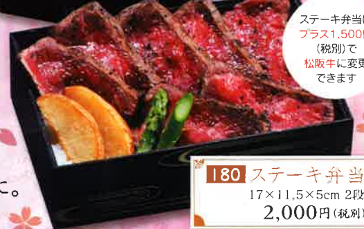
180 ステーキ弁当 17×11.5×5cm 2段 2,000円(税別)

お祝いの席への彩りに。ご家族や、会社、サークルの集まりのお供に。多彩なメニューの中から用途やお好みに合わせてお選び下さい。