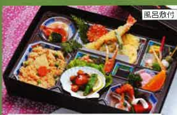
652 お持ち帰り箱御膳会席 28×38cm 4,200円(税別)