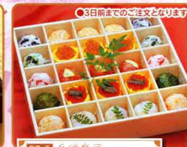
OT-3 手總寿司 27.8cm角 高さ5cm 3,800円(税別)