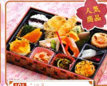
101 こはる 17.5×26.5cm 1,350円(税別)