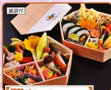
109 鯛(にしき) 紙袋付 17.5×23.5cm 2段 3,100円(税別)